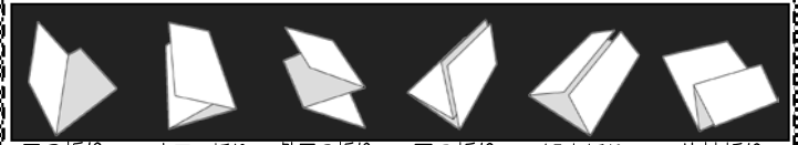
二つ折り 内三つ折り 外三つ折り 四つ折り 観音折り 片袖折り