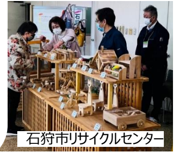
石狩市リサイクルセンター