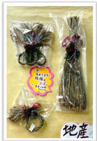
農家さんの手作り稲穂リース (材料は石狩産なまつほし)