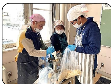
1月 味噌づくりといしかり食と農の応援隊による豚汁の提供